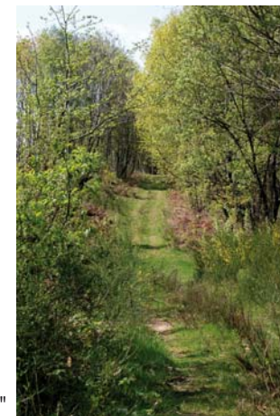
Un chemin du circuit "la randonnée"

La commune a dégagé un point de vue à proximité du circuit et propose un joli panorama sur le village et ses environs.