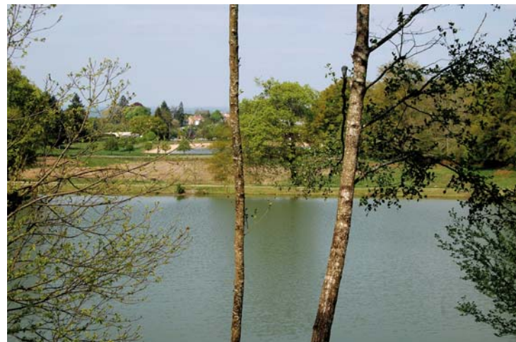
Paysage, à partir du sentier